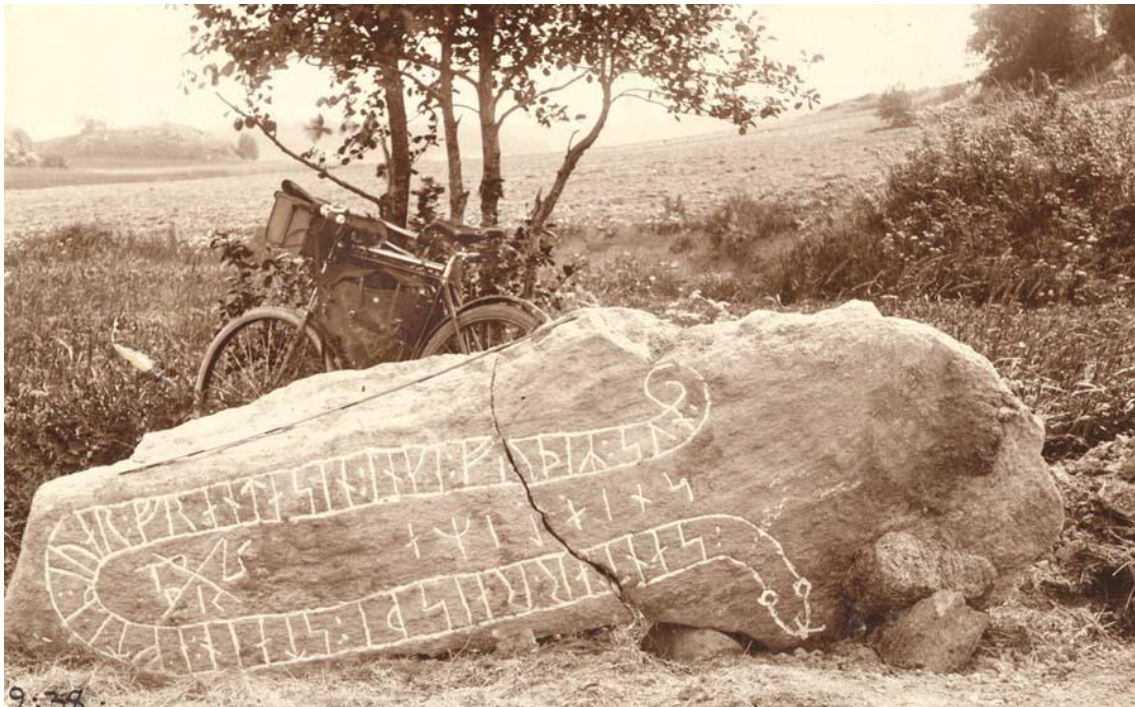
Stenen upptäckt av torparen K.J.Ekblom som arbetade med att öka djupet på bäcken. 1882-83 Foto : Erik Brate (Den cyklande runspecialisten) 1899